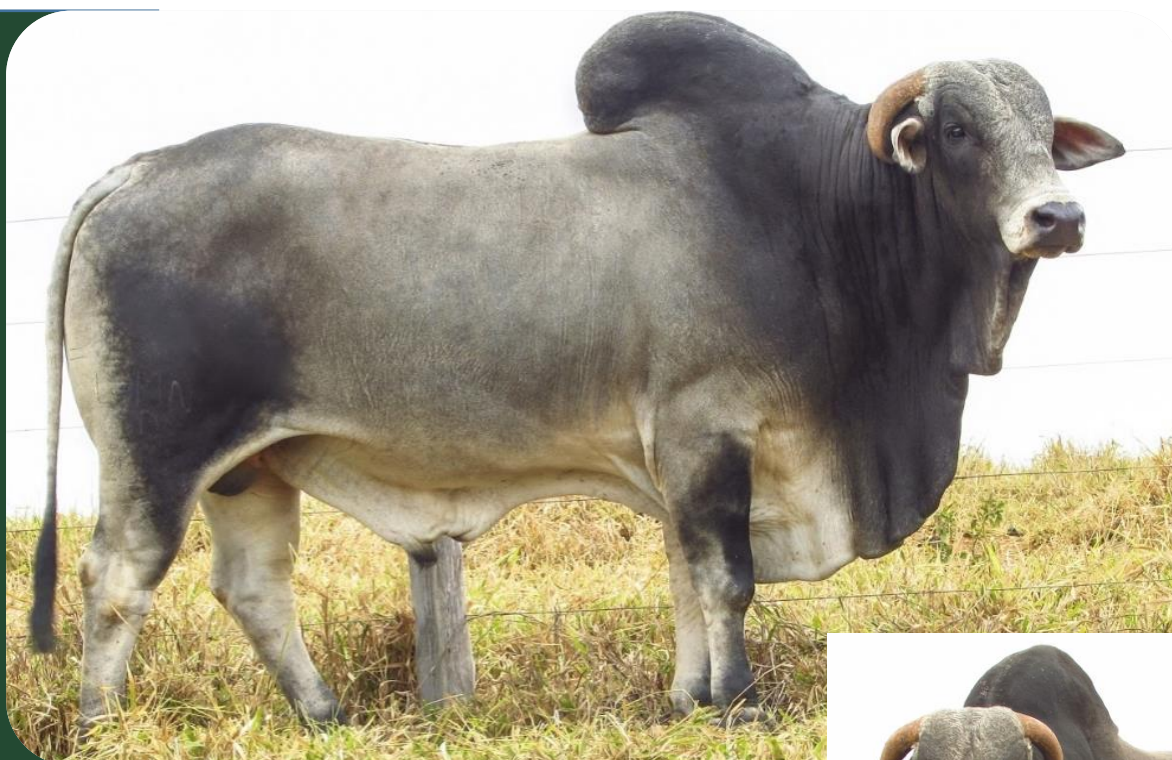
Registro nº LBMN D7117 - Data Nascimento 02/11/2011